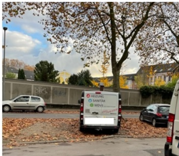
14 15 Fotos Standort Lipperheidstr. 110 , Höhe Marienfriedhof vom 14. Januar 2018 und vom 05. Oktober 16 2021, Quelle Fotos: Bert Buschmann 17