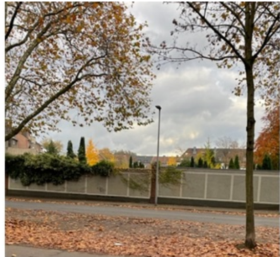
18 19 Fotos Standort Lipperheidstr. 98, Höhe Marienfriedhof vom 14. Januar 2018 und vom 05. Oktober 20 2021 21